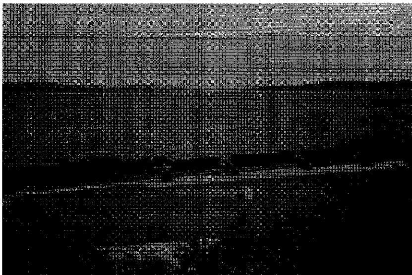
Fortaleza de Ahui, San Carlos de Ancud.

La condición excepcional de Chiloé puede sintetizarse, como dicen Semprún y Bullón de Mendoza en «que a lo largo de esta época (1819-1822), Chiloé constituye un pequeño estado cuyo destino es considerado por diversas potencias europeas y también de las nuevas que aparecen en América». 16 El aislamiento de Chiloé no significó su ausencia de la empresa de reconquista. Quintanilla envió refuerzos al coronel Ordóñez que resistía en el puerto de Talcahuano, a El Callao (Perú), y a la Araucanía: en suma, en toda zona donde se sostuviera la bandera realista. Las unidades chilotas siguieron combatiendo hasta el Alto Perú, actualmente Bolivia, tras el desastre en Perú, donde se unieron a las últimas tropas de Olañeta.